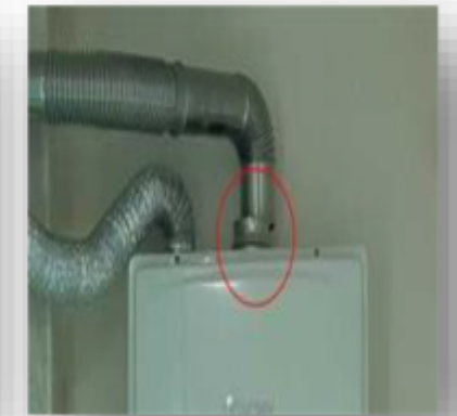
<보일러 배기통 이탈>

점검결과 "불량" 및 가스냄새 등 이상이 있는 경우 귀뚜라미에너지 콜센터 (1670-4700) 로 연락하여 주시기 바랍니다