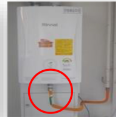
<보일러 연결부 누출>